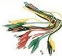
krokodyłki zacisk akumulatorowy pinzas cocodrilo