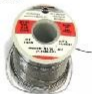
ołów do spawania plomo de soldar