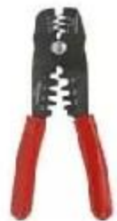
szczypce do zaciskania herramienta de engaste